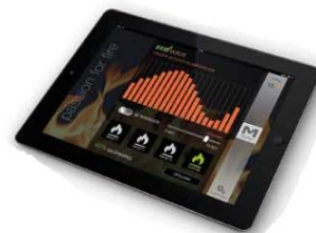
Ved sett H1